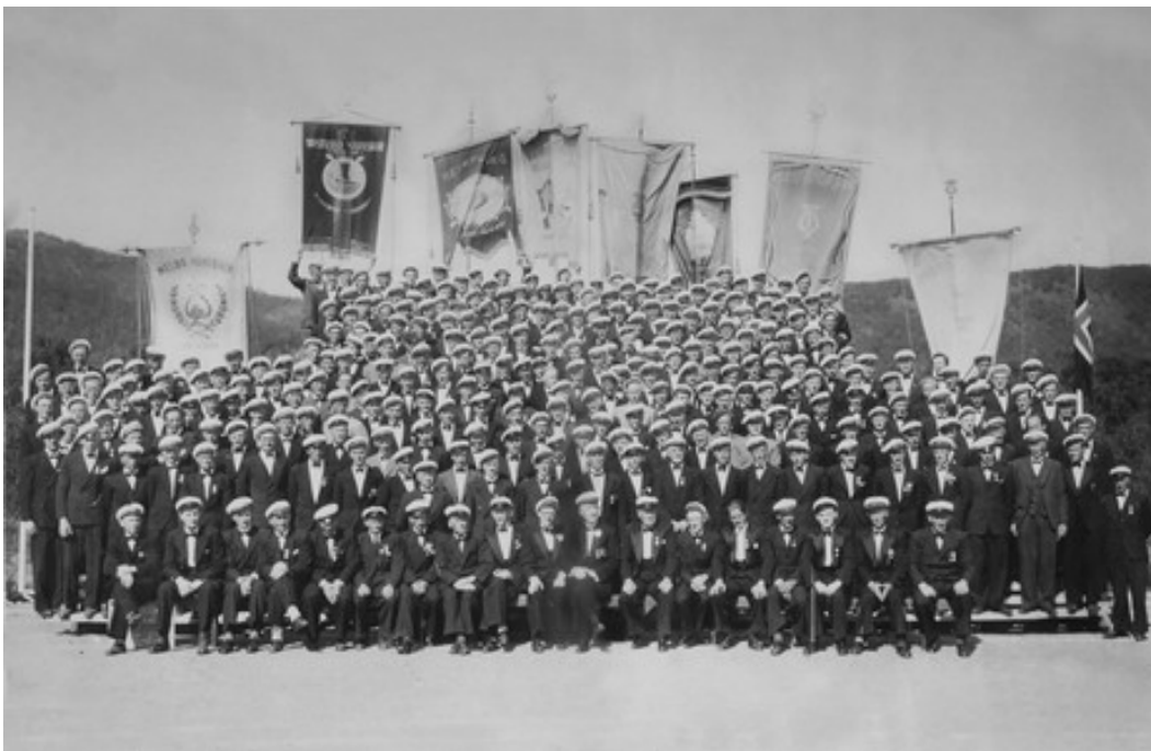
Vesterålen Mannssangerforbund er trolig første regionale kulturorganisasjon (1932). Det sies at mange av de som utviklet det regionale vesterålssamarbeidet i offentlig regi var sentrale i korbevegelsen. En sammenheng? Her fra mannsangerstevnet på Melbu i 1948.